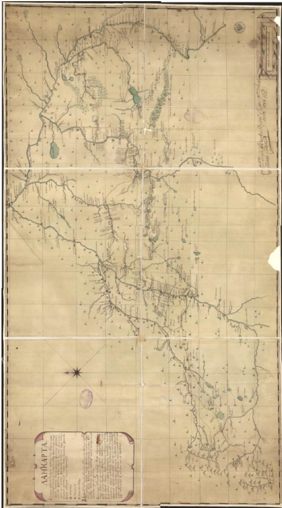
Рис. 1. Ландкарта. Описание мест Исетской провинции... («Карта капитана Новоселова 1743 г.»), общий вид Fig. 1. Map. Description of places in the Isetskaya province... («Captain Novoselov's map of 1743»), general view