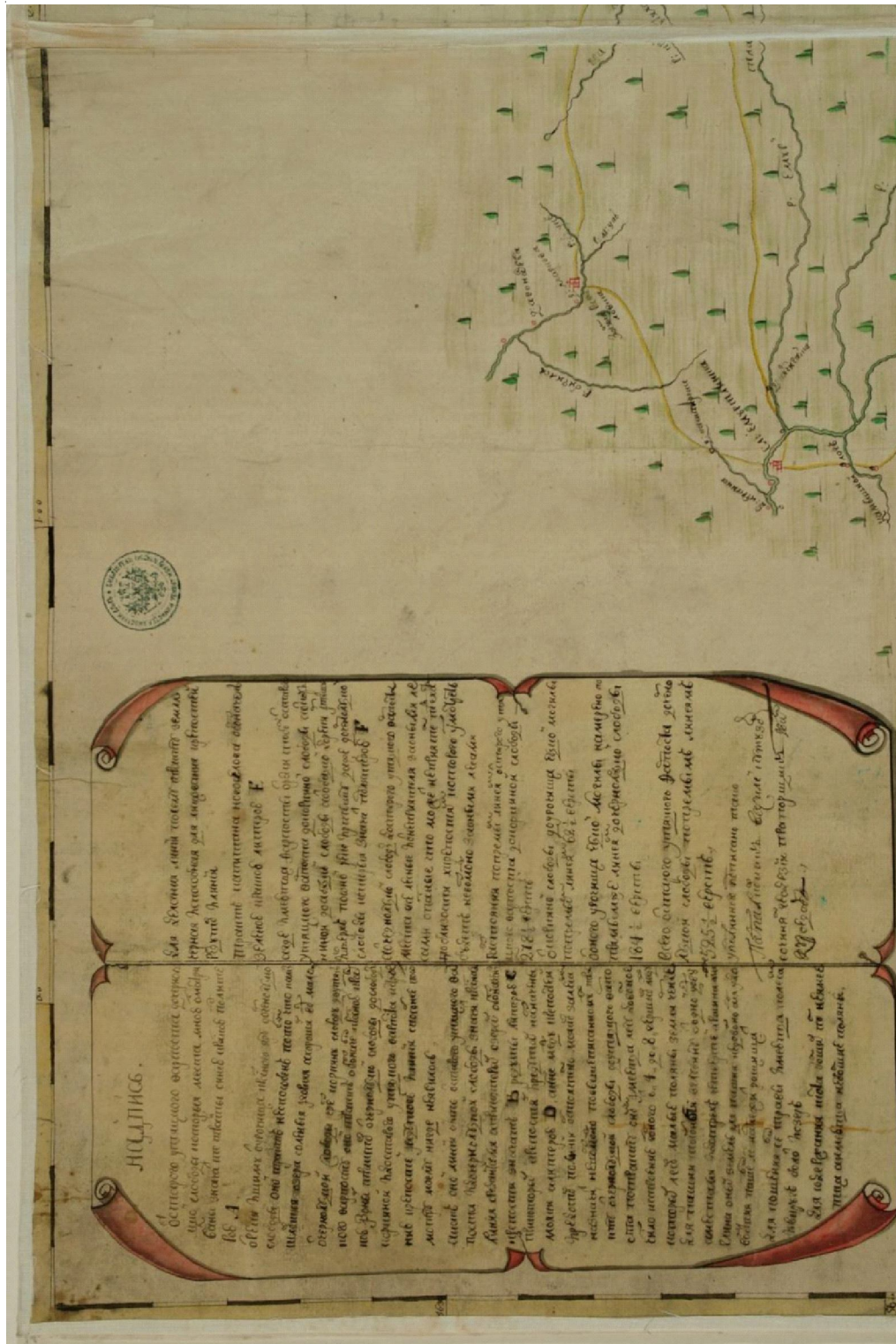
Рис. 2. Карта Сибирской губернии от старого Утыцкого форпоста до реки Иртыша и до Чернолуцкой слободы... («Карта Василия Кутузова 1745 г.»), фрагмент с картушем Fig. 2. Map of the Siberian province from the old Utyatsky outpost to the Irtysh River and to the Chernomolutskaia settlement... («Vasily Kutuzov's map of 1745»), fragment with cartouche