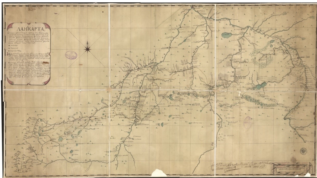
Илл. 1. Ландкарта. Описание мест Исетской провинции... или «Карта капитана Новосёлова», общий вид РГАДА 192.1. Тобольская губерния 1

5 Вторая карта 15 (Илл. 2) еще более интересна, так как является чем-то вроде картографической стенограммы части споров по маршруту прохождения Новой Ишимской линии, приоткрывая, таким образом, часть процесса принятия решений, определивших конфигурацию границы Империи с Казахской степью почти на сто лет и не менее драматично повлиявших на другие, в том числе более поздние элементы культурного ландшафта Сибири и Казахстана.