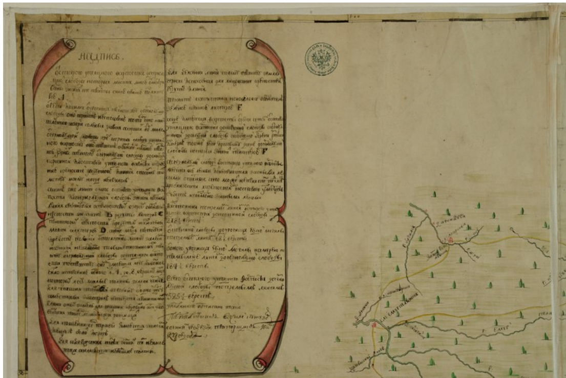
Илл. 3. Карта Сибирской губернии от старого Утяцкого форпоста до реки Иртыша и до Чернолуцкой слободы... или «Карта Василия Кутузова», фрагмент с картушем РГАДА 192.1. Тобольская губерния 2